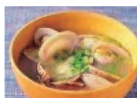
あさり 10個 (40g) 1.5mg