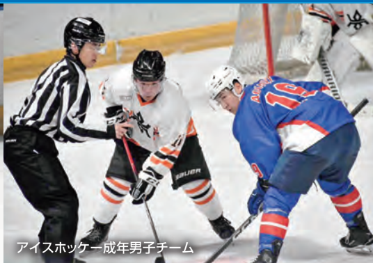
アイスホッケー成年男子チーム

女子20 + リレー 2走小田田凜花(右、 南昌みらい高)選手から3位で3走釜石 知奈(南昌みらい高)選手につなぐ 2026年2月18日付