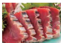
カツオの刺身 5切れ (80g) 1.5mg