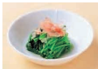
ほうれん草 小鉢 1つ (50g) 1.0mg