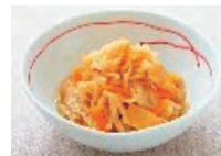
切り干し大根煮物 小鉢 1つ (切干 5g) 0.6mg