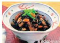
ひじきの煮物 小鉢 1つ (ひじき 5g) 0.8mg