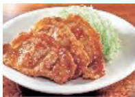
豚肉生姜焼き 3枚 (80g) 0.5mg