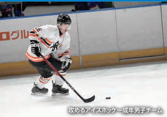
攻めるアイスホッケー成年男子チーム