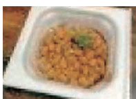
納豆 1パック (50g) 1.7mg