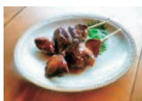
焼き鳥 レバー 2本 (60g) 5.4 mg

非ヘム鉄 ：小松菜やほうれん草などの緑黄色野菜、大豆など。動物性たんぱく質やビタミンCと一緒にとることで吸収率が高まります。