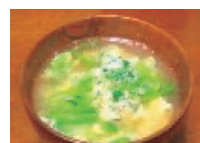
小松菜と卵の味噌汁 (50g+2/1個) 2.1mg