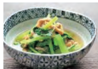
小松菜と油揚げ煮びたし 小鉢 1つ 1.4mg