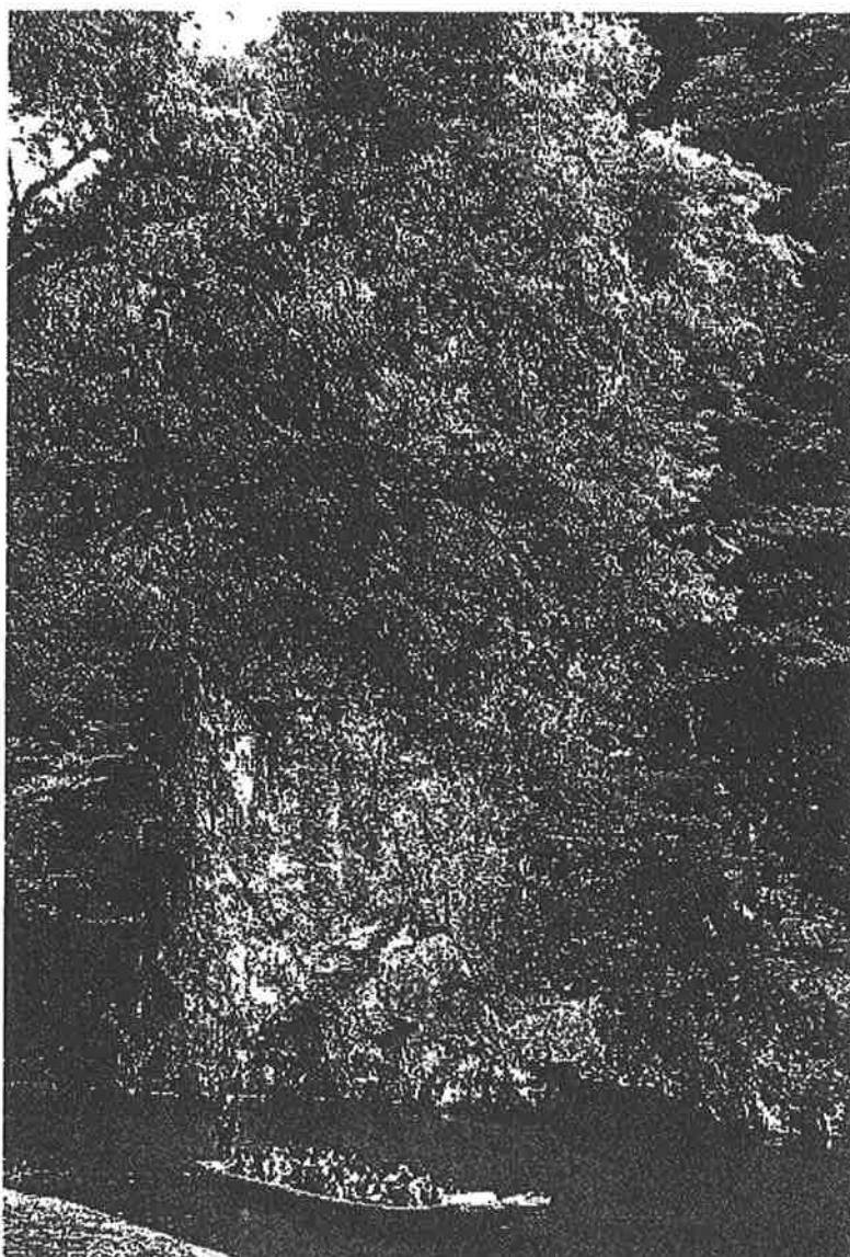
(岩手県一関市東山町 狹鼻溪)

期 日 2013年(平成25年)7月6日(土)～7月7日(日) 会 場 一関市総合体育館